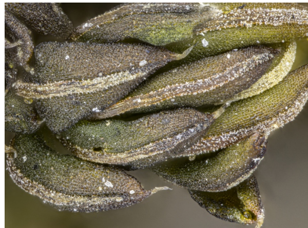
Abb. 4: Syntrichia papillosa in trockenem Zustand. Die dorsale Seite der Blätter, insbesondere die Rippe, ist von zahlreichen Papillen bedeckt. Lange Bildkante 1,8 mm (N. J. Stapper).