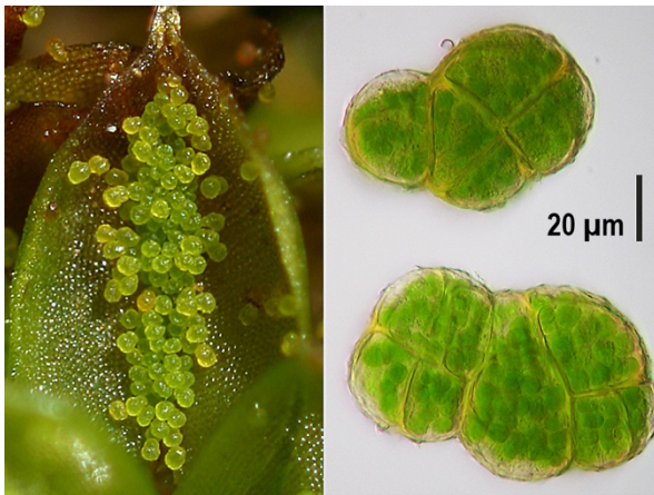
Abb. 3: Syntrichia papillosa , Blick auf die Ventralseite eines Blattes mit zahlreichen Brutkörpern, die (rechte Bildhälfte), um die 50 µm groß sind und der vegetativen Verbreitung der Art dienen (N. J. Stapper).

Eines der häufigsten Moose an den Bäumen im Volksgarten ist Syntrichia papillosa . Charakteristische Merkmale dieser Art, die nicht nur im Park, sondern auch an Alleebäumen in der Innenstadt große Flächen auf den Stämmen überziehen kann, sind zum einen die Brutkörper auf der Blattrippe (Abb. 3). Diese sieht man jedoch nur dann, wenn das Moos feucht ist. Im trockenen Zustand sind die Blätter eingerollt, das Moos ist jetzt dunkelgrün, und durch die zahlreichen Papillen auf der uns nun zugewandten Blattunterseite wirkt es wie von Raureif überzogen (Abb. 4).