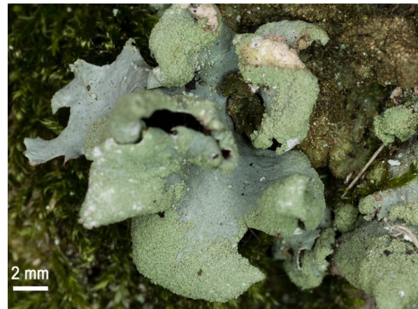
Abb. 2: Hypotrachyna revoluta (N. J. Stapper).