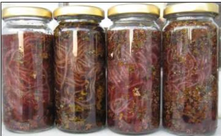
Şekil 2. % 3'lük amonyak kullanılmış yün ipliğin likenlerle cam kavanozlarda bekletilme aşaması (AFM) Figure 2. The process of fermentation in ammoniac 3%.