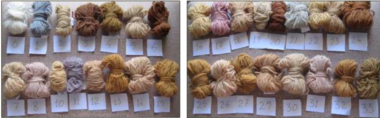
Şekil 3. Boyanmış yün iplikler (Örnek numaralarına göre kullanılan liken türleri ve elde edilen renk tonları Tablo 2’de verilmiştir).