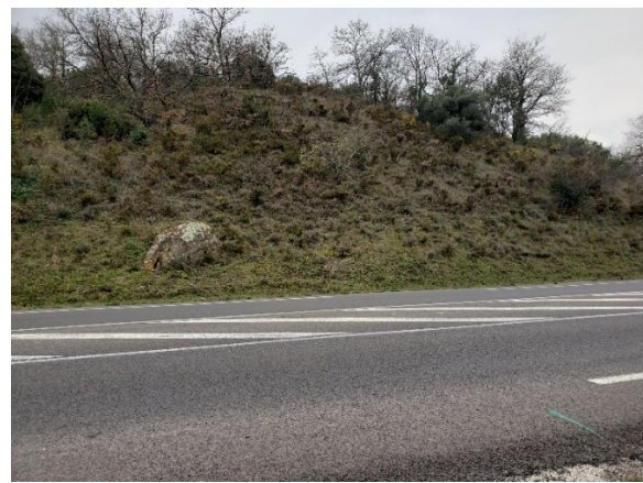
Photo 2. Le talus routier où Cladonia rei a été observé ; © L. Giardi.