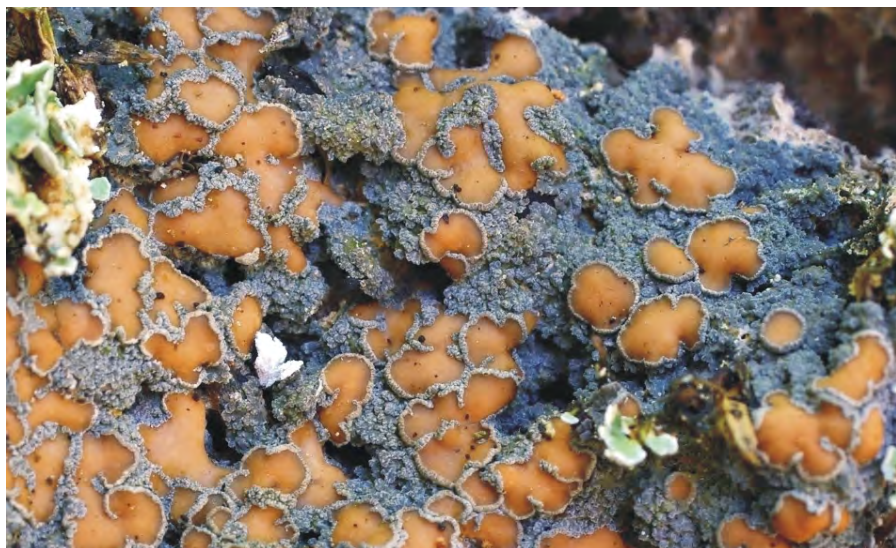
Obr. 7. Protopannaria pezizoides – Rolavská vrchoviště – cínový důl, cihla; PL BL 2806.