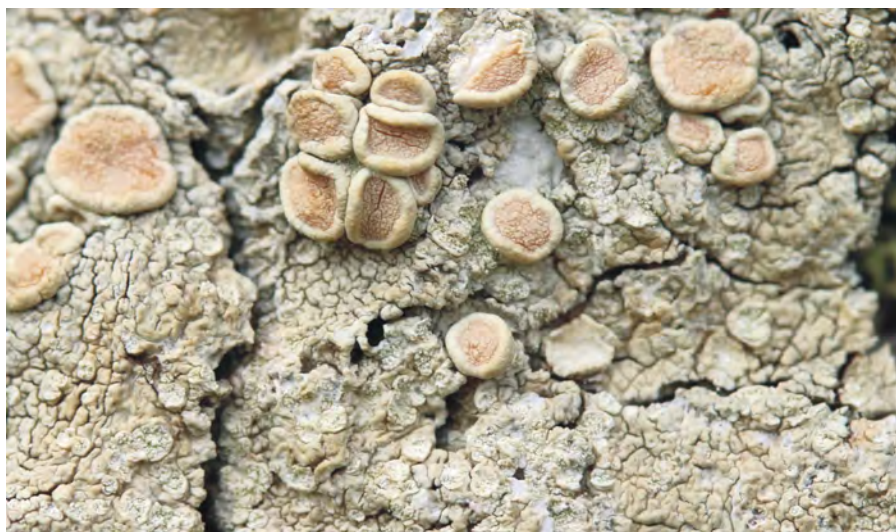
Obr. 4. Ochrolechia alboflavescens – Hohe Tauern, poblíž Sajathütte, borka modřínu.