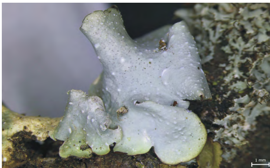
Obr. 6. Punctelia borrieri – Šlovický vrch u Dobřan, větev trnky; PL BL 2781.