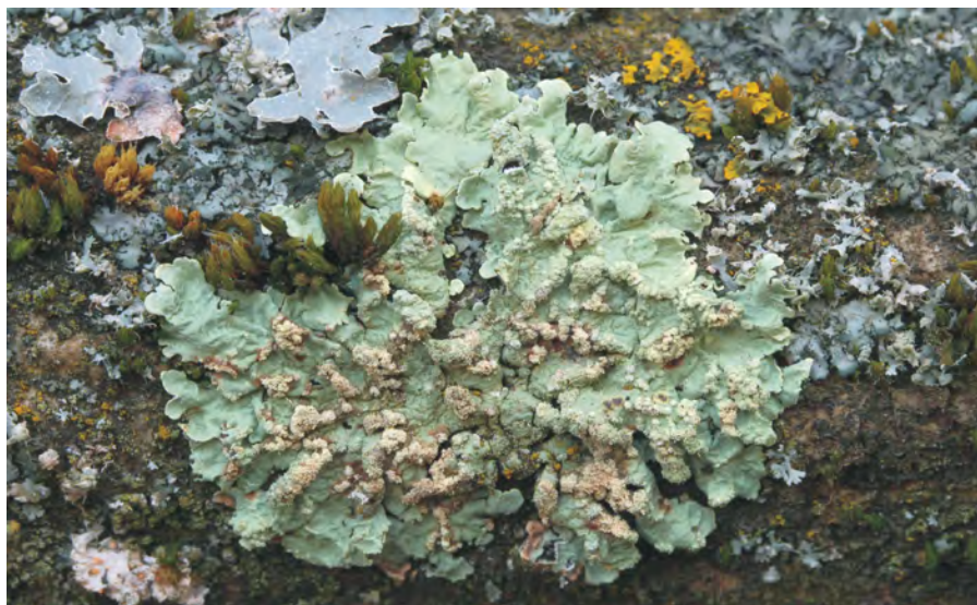
Obr. 3. Flavoparmelia soredians – Dobřany – cihelna, borka brslenu; PL BL 2762.