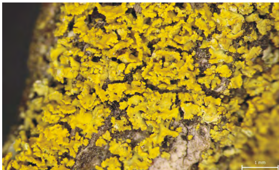
Obr. 1. Candelaria pacifica – Sušice, borka lípy; PL BL 2715.