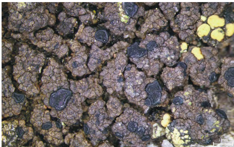
Obr. 8. Schaereria cinereorufa – Ryžovna, fylit; PL BL 2807.