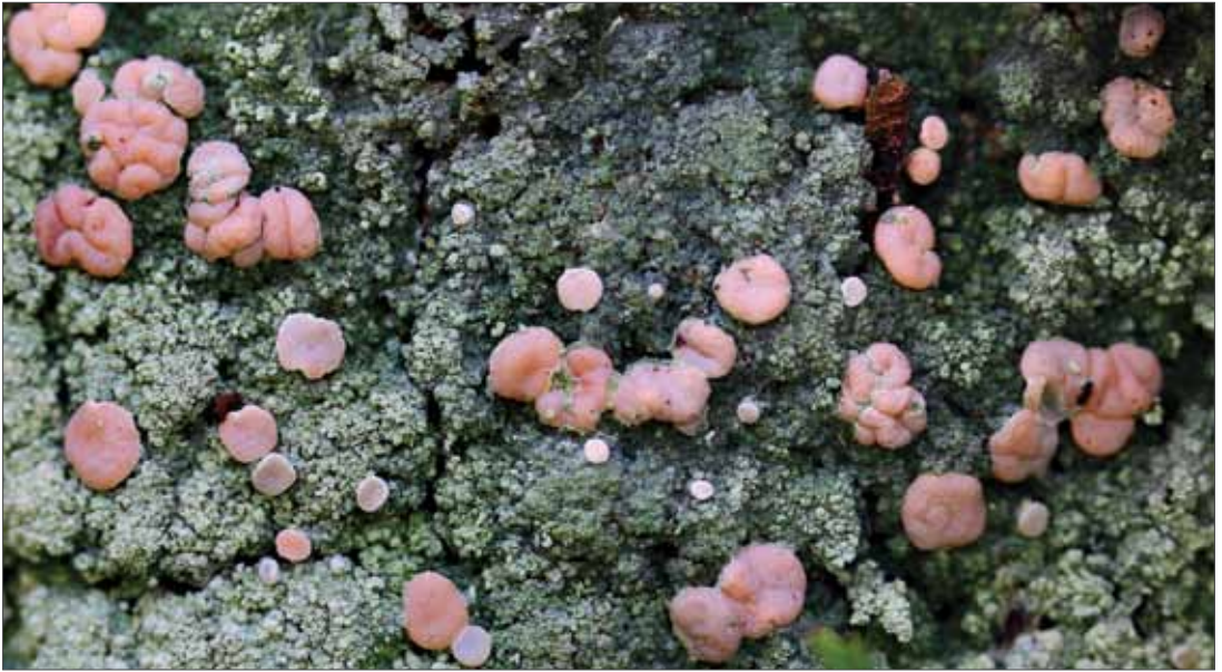
Icmadophila ericetorum bevorzugt feuchtigkeitspeicherndes Substrat (Torf, Rohhumus, Faulholz) in montanen bis alpinen Lagen. Die Art wurde 2014 nach mehr als 100 Jahren wieder nachgewiesen. Brocken, 2014, Foto: H.-U. Kison.