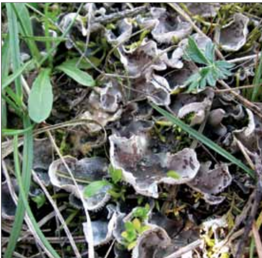
Peltigera extenuata , gut kenntlich durch die flächenständigen Sorale, die mit C+ rot reagieren, ist ein Neufund für ST. 2014, Foto: M. Schönbrodt.