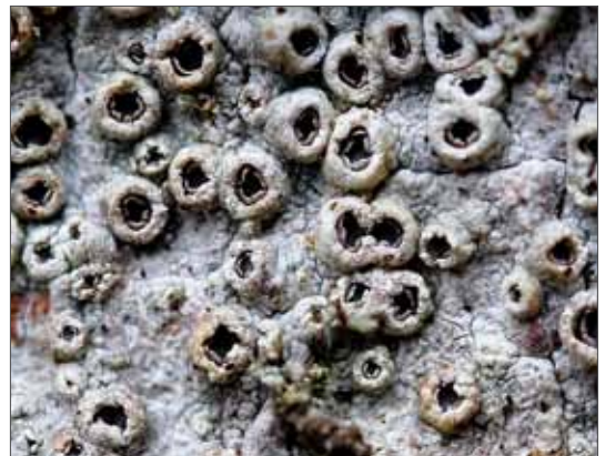
Thelotrema lepadinum , eine Krustenflechte an alten Baumstämmen, bevorzugt kühle, luftfeuchte und windgeschützte Standorte. Sie wurde 2013 nach mehr als 170 Jahren wieder nachgewiesen. Ilsetal, 2014, Foto: H.-U. Kison.

Vereinzelte Angaben zur Verbreitung von Arten in unserem Gebiet finden sich in zahlreichen älteren Florenwerken. Eines der ersten dürfte SCHOLLER (1775) sein, im 19. Jahrhundert folgten dann Werke von WALLROTH (1831), KÖRBER (1865), KUMMER (1883) und die unter dem Namen der jeweiligen Bearbeiter genannten Teile von RABENHORSTS Kryptogamenflora, die über einen längeren Zeitraum erschienen. Parallel dazu begann aber auch die intensivere Bearbeitung einzelner Gebiete von Sachsen-Anhalt. So verfasste SCHWABE (1839) eine Flora von Anhalt, SPRENGEL (1832) und GARCKE (1856) legten Ergebnisse von Halle und Umgebung vor. Eine besondere Anziehungskraft für Lichenologen übten stets der Harz und das Harzvorland aus, sodass zahlreiche Beiträge aus dieser Region existieren, in denen teilweise auch neue Arten beschrieben wurden. Eine frühe Liste (noch ohne konkrete Fundortangaben) wurde von HAMPE (1837) erstellt, weitere Beiträge stammen von WEDDE (1909) und ZSCHACKE (1909, 1922), um nur einige Beispiele zu nennen. Auch in seinen Arbeiten über Moose erwähnt ZSCHACKE immer wieder Flechten (ZSCHACKE 1905, 1911). Weitere nennenswerte Arbeiten aus dem Harz stammen von LAMPE & KLEMENT (1958) und SCHUBERT & KLEMENT (1961). REIMERS (1940, 1950) befasste sich mit den Bunten Erdflechtengesellschaften, die vor allem auf Kalk und Zechstein-Gips im südlichen Harzvorland sowie im Kyffhäuser, der überwiegend zu Thüringen ge-