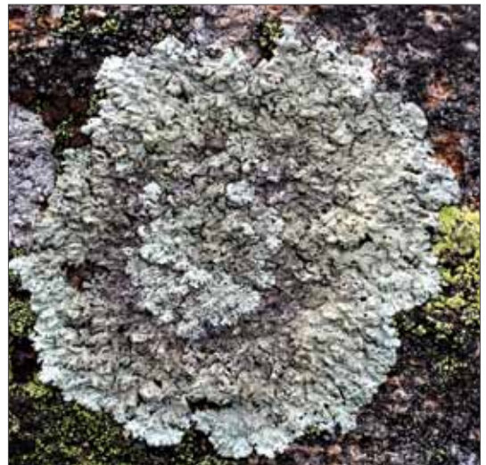
Arctoparmelia centrifuga ist ein Eiszeitrelikt und wächst in Sachsen-Anhalt nur in den höchsten Lagen des Harzes. Hölenklippe, 2014, Foto: H.-U. Kison.