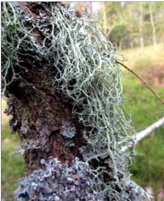
Evernia divaricata , meist an sauren Rinden zu finden, wächst üblicherweise an kalten nebelreichen Standorten in montanen und hochmontanen Lagen. Sie wurde 2014 nach mehr als 140 Jahren wieder nachgewiesen, interessanterweise im Tiefland. Glücksburger Heide, 2014, Foto R. Thiemann.

In der Spalte Nachweis wird der jeweils jüngste bekannt gewordene Nachweis eines Taxons (Stand März 2016) aufgelistet. Es werden die Jahreszahl und eine oder mehrere Gewährspersonen angegeben, wobei ab vier Personen nur noch eine Person mit et al. aufgeführt wird. Angaben, die von mehreren Teilnehmern der jährlich stattfindenden Frühjahrsexkursionen gemeldet wurden, sind mit „Frühjahrsexk. ...“ und dem Namen des Exkursionsgebietes in der Liste zu finden. Liegen der Fund oder die Beobachtung einer Art und die Veröffentlichung zeitlich mehrere Jahre auseinander, werden meist beide Daten aufgeführt, d. h. das Literaturzitat wird dem Fund mit „zit. in“ angefügt. Auch für die bereits ausgestorbenen Arten wird versucht, den jeweils letzten Nachweis anzugeben. Das kann sowohl eine Literaturquelle, ein Exsiccatenwerk oder aber ein aufgefundenen Herbarbeleg sein. In letzterem Fall wird das Herbar Kürzel nach Index Herbariorum in Klammern dem Namen des Sammlers nachgestellt.