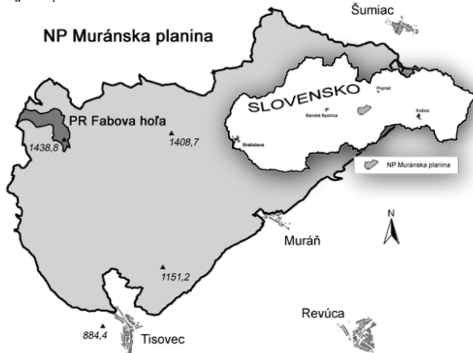
Fig. 1. Map of the Muránska Planina National Park and of the studied area at Fabova hoľa massif.