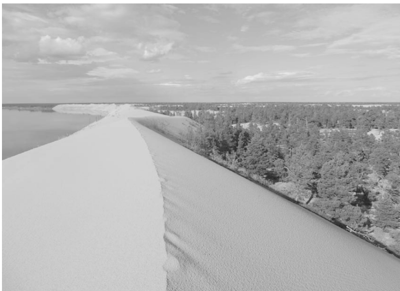
Рис. 1. Кысыл-Сырский тукулан в среднем течении р. Вилюй.