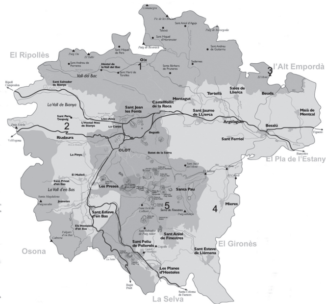
FIGURA 1. Localitats estudiades a la Garrotxa: 1) bosc del Quer; 2) l'Espunya; 3) Falgars; 4) roca de Migdia; 5) el Ventós.

zats van ser els habituals en els estudis líquenològics (Purvis et al. , 1992). En alguns casos, ha calgut estudiar les substàncies líquèniques per a una correcta identificació dels espècimens. Aquestes han estat identificades mitjançant cromatografia en capa fina segons Elix & Ernst-Russell (1993).