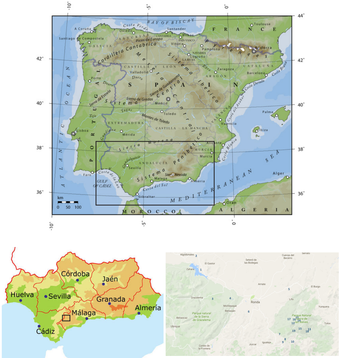
Figure 1. Location of visited sites in Serranía de Ronda.

da, which includes 17 sites in the province of Málaga and two in the province of Cádiz (Figure 1) in cooperation with the Mandragora group in this occasion (which belongs to the Serranía de Ronda Studies Association).